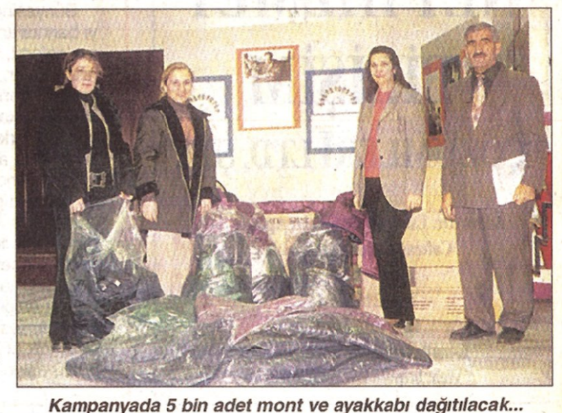
Kampanyada 5 bin adet mont ve ayakkabı dağıtılacak...

Ekonomik sıkıntılarının her geçen gün arttığı ülkemizde, özellikle Kadıköy'de yaşayan yoksul ve yardıma muhtaç vatandaşlara yardım etmek için Kadıköy Kaymakamlığı Sosyal Dayanışma ve Yardım Vakfı devreye girdi. Kadıköy Kaymakamlığı ile İlçe Milli Eğitim Müdürlüğü'nün koordinasyonuyla gerçekleştirilen yardım kampanyası kapsamında, Kadıköy'de yaşayan yoksul ailelerin güç şartlarda eğitime devam eden çocuklarına giysi ve ayakkabı bağışı yapıyor. Kadıköy Kaymakamlığı Sosyal Dayanışma ve Yardım Vakfı ile Kadıköy İlçe Milli Eğitim Müdürlüğü işbirliğiyle dar gelirli ailelerin çocuklarına yönelik olarak geçen ay başlatılan kampanya kapsamında, 5 bin adet mont ve 5 bin adet ayakkabı ihtiyaç sahibi çocuklara dağıtılacak. Yetkililer, kıyafetlerin Kadıköy'deki okul müdürleri ve öğretmenlerinin kurduğu komisyon tarafından seçilecek yoksul öğrencilere dağıtılacağını ve kampanyanın devam edeceğini söylediler.