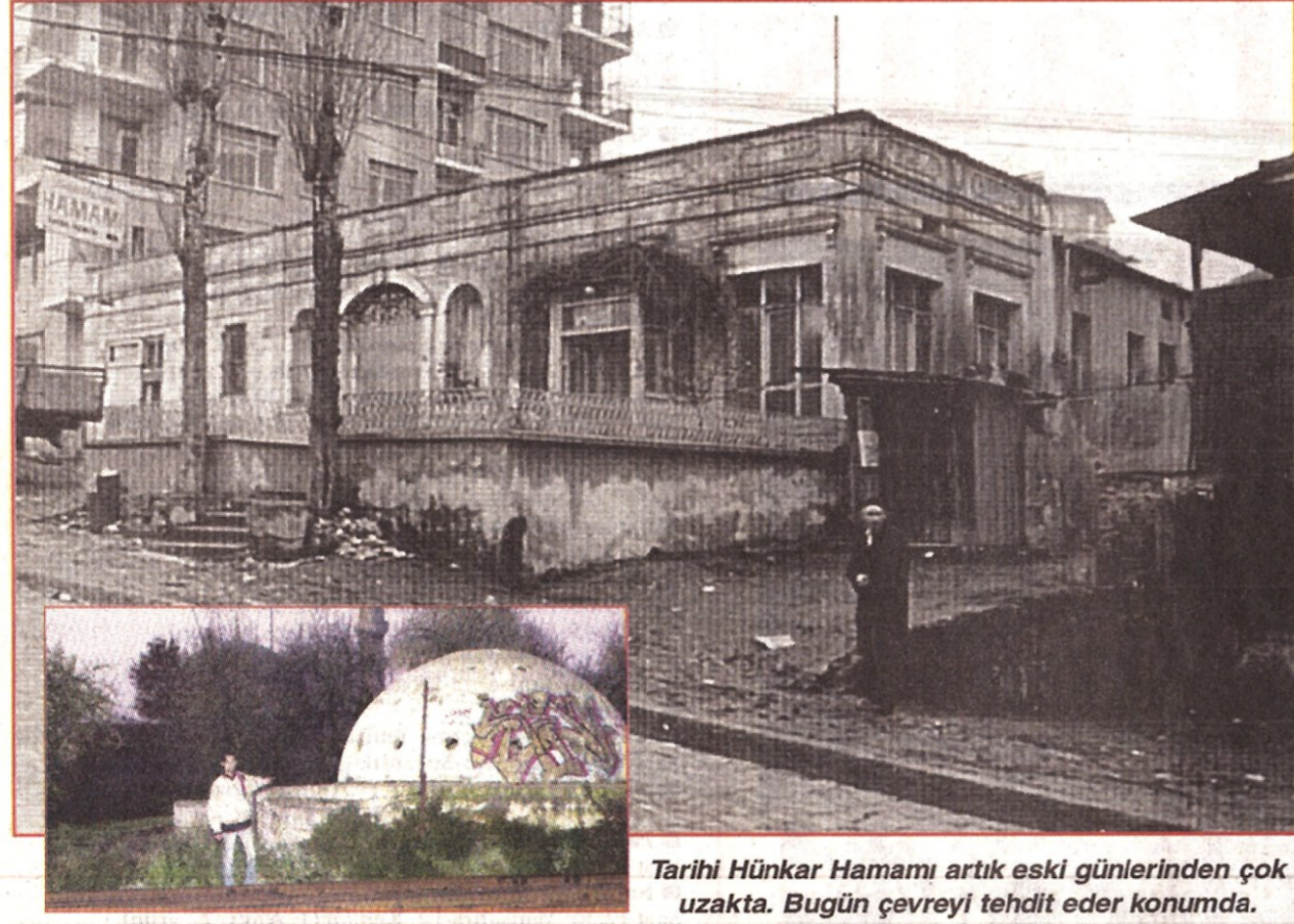
Tarihi Hünkar Hamamı artık eski günlerinden çok uzakta. Bugün çevreyi tehdit eder konumda.