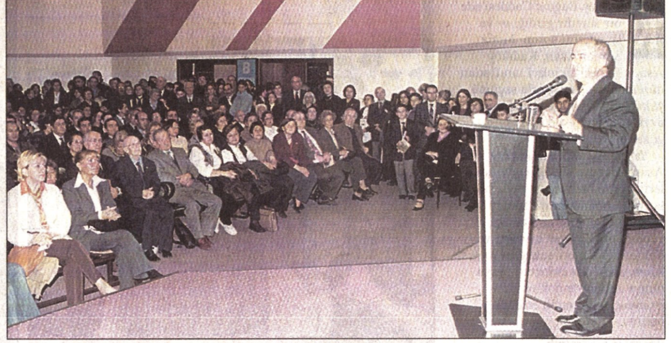
Evlendirme Dairesi'nde düzenlenen programda konuşan Başkan Öztürk, eğitimin önemini anlattı...

zartesi günü Kadıköy Belediyesi Evlendirme Dairesi'nde şair Sunay Akın'ın konuk olduğu Öğretmenler Günü Kutlama programı gerçekleştirildi. Kadıköy Belediyesi tarafından geleneksel hale getirilen ve yaklaşık 1000 öğretmenin katıldığı Öğretmenler Günü Kutlama programına bu yıl da ilgi büyüktü. Programın açılış konuşmasını, Kadıköy Belediye Başkanı Selami Öztürk yaptı. Öztürk, konuşmasında Türkiye'nin eğitim sorunlarını dile getirerek, "Türkiye'nin bugün hangi problemi ortaya konulursa konulsun, problemin temelinde eğitim eksikliğinden kaynaklandığını görmemek mümkün değil. Türkiye'de eğitim sorunu temelden halledilmediği sürece, hiçbir sorununun çözülemeyeceğine inanmıyorum. Atatürk'ün başlatmış olduğu aydınlanma çağına devam etmiş olsaydık Türkiye bugün Avrupa Birliği'nin kapılarında bekleyen değil, masada oturmuş söz sahibi olan, refahın nasıl paylaşıldığını gösterdiği ender müslüman ülkelerden biri olacaktı" dedi. Öztürk her aydınlanma döneminin karşıtı güçlerin olduğunu, bu güçle-