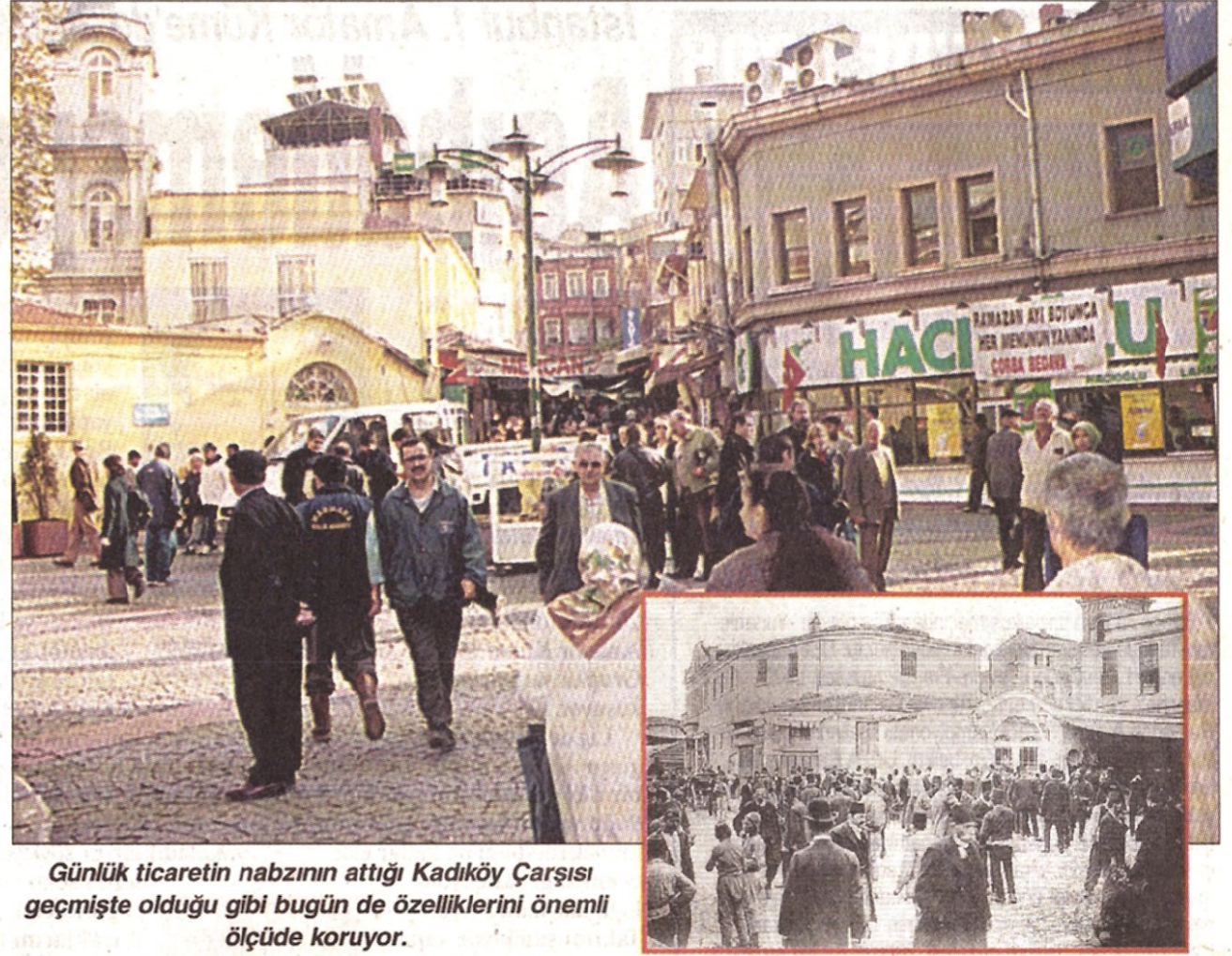
Günlük ticaretin nabzının attığı Kadıköy Çarşısı geçmişte olduğu gibi bugün de özelliklerini önemli ölçüde koruyor.

Çocuklarımız, kadınlarımız buradan geçerken korkuyorlar. Çünkü hamamın içinde ve civarında birçok tineri bulunuyor. Bunlar yoldan geçen insanlara laf atıp, kimi zaman da tacizde bulunuyorlar. Eğer burası düzenlenip kullanılan alan haline gelirse, tineriler kendiliğinden bu alanı terk edecekler. Sorunun bir an çözümlenmesini istiyoruz.