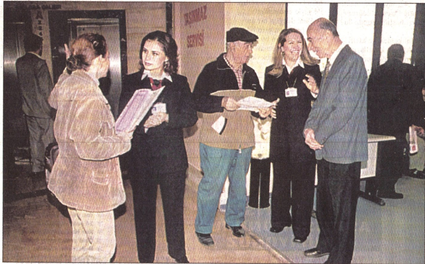
Kadıköy Belediyesi'ne girdiğinizde artık size yardımcı olan bayanlarla karşılaştığınızda şaşırmayın..