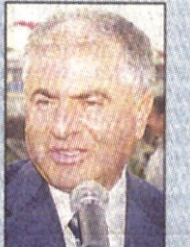
Selami ÖZTÜRK (Kadıköy Belediye Başkanı)

Kadıköylülere K daha iyi hizmet için projeler üretmeye devam ediyoruz. e-belediyeçilik dediğimiz çağdaş teknolojiyi kullanarak belediye hizmetlerinin yerine getirilmesiyle birlikte planladığımız yeni Halkla İlişkiler yapılanmasının bir parçası olan Halkla İlişkiler görevlisi elemanlarımızı da göreve başlattık. Bu genç kızlarımız belediye koridorlarında görev yapacaklar. Tıpkı evimize gelen misafirleri karşılamamız gibi gelen misafirlerimizi güler yüzle karşılayıp ilgilenenler, çay ısırtmaya ve sorunlarını kısa sürede çözecekler. Diğer birimlerdeki arkadaşlarımız da bu elemanlarımıza yardım edecekler. Yeni yapılanma içinde halkla ilişkiler alanında yeni projeler de kısa zamanda uygulamaya girecek.